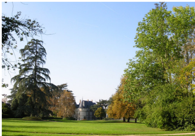
1 - Henri Duchêne, Parc de Chaumont-sur-Loire

Les journées Henri et Achille Duchêne 8, 9 & 10 novembre 2019