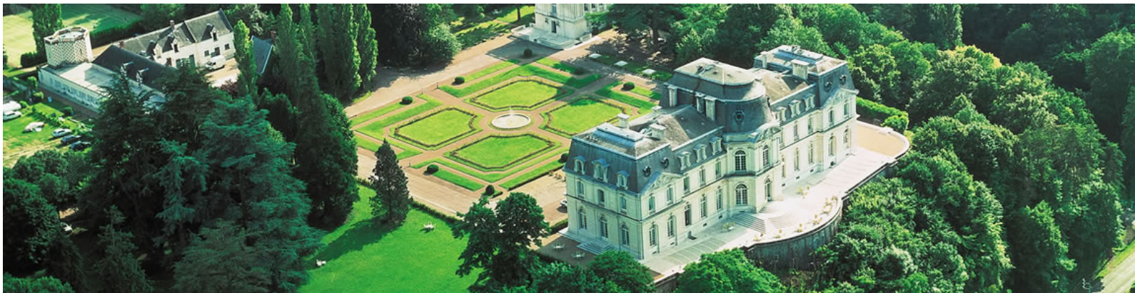
Le château d'Artigny, Montbazon (37) Achille Duchêne, parc et parterres français