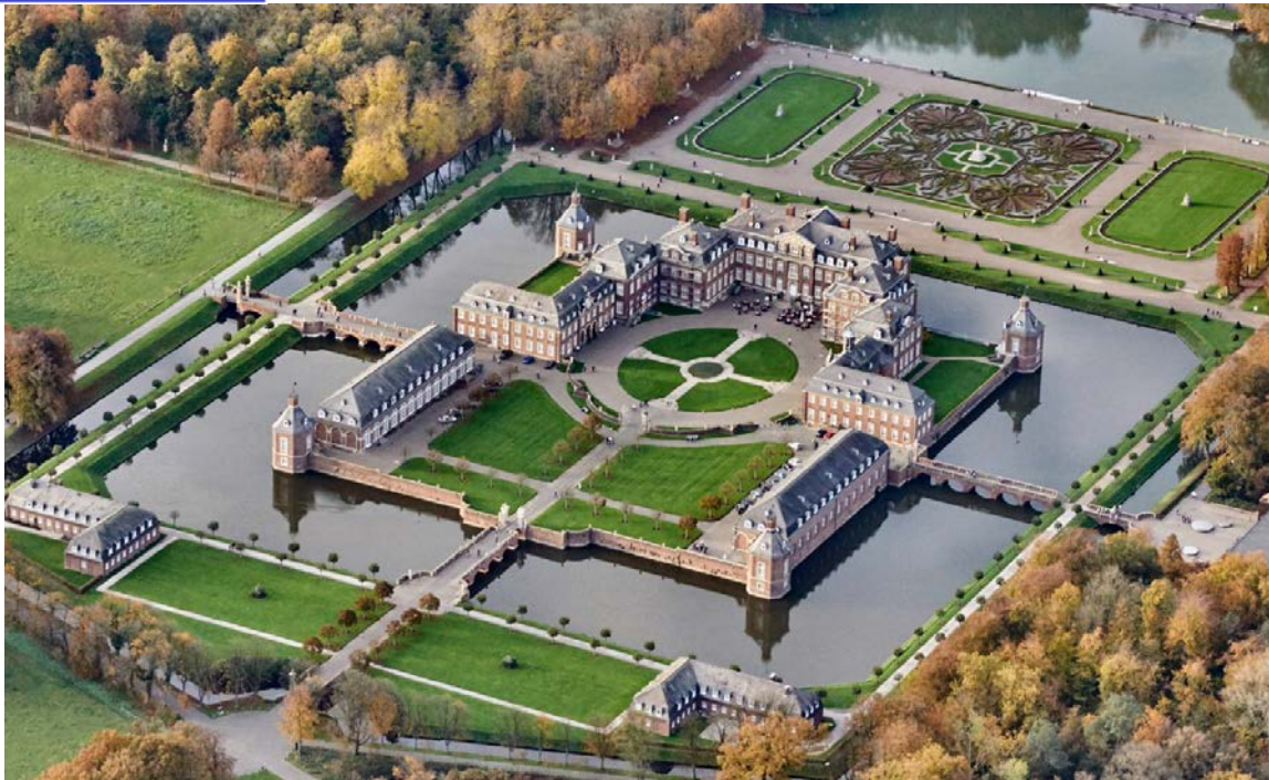
6 – Achille Duchêne, Parc du château de Nordkirchen (Rhénanie-du-Nord-Westphalie)

Les journées Henri et Achille Duchêne 8, 9 & 10 novembre 2019