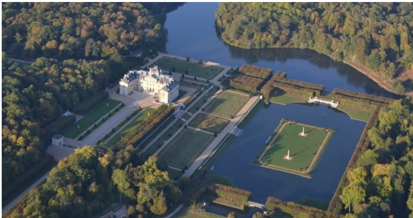
4 – Henri et Achille Duchêne Parc du château de Voisins, Saint-Hilarion (Yvelines)