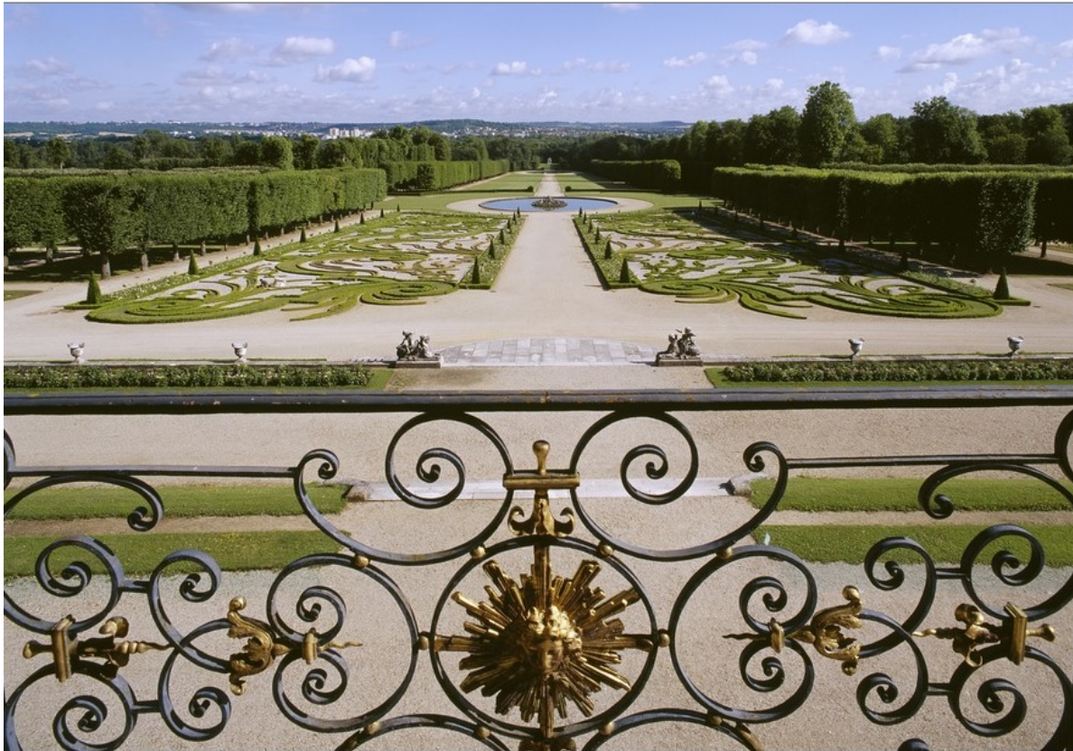
3 – Henri Duchêne Parc du château de Champs-sur-Marne

Les journées Henri et Achille Duchêne 8, 9 & 10 novembre 2019