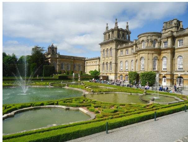
2 - Achille Duchêne, Parterre d'eau, Blenheim Palace

Les jardins des architectes-paysagistes Henri et Achille Duchêne sont devenus de véritables icônes de l'histoire de l'art, qu'il s'agisse du parc de Chaumont-sur-Loire ou des parterres de Champs-sur-Marne, des précieuses broderies du parc de Vaux-le-Vicomte ou, encore, du parterre d'eau créé devant la grande façade baroque du palais de Blenheim en Angleterre.